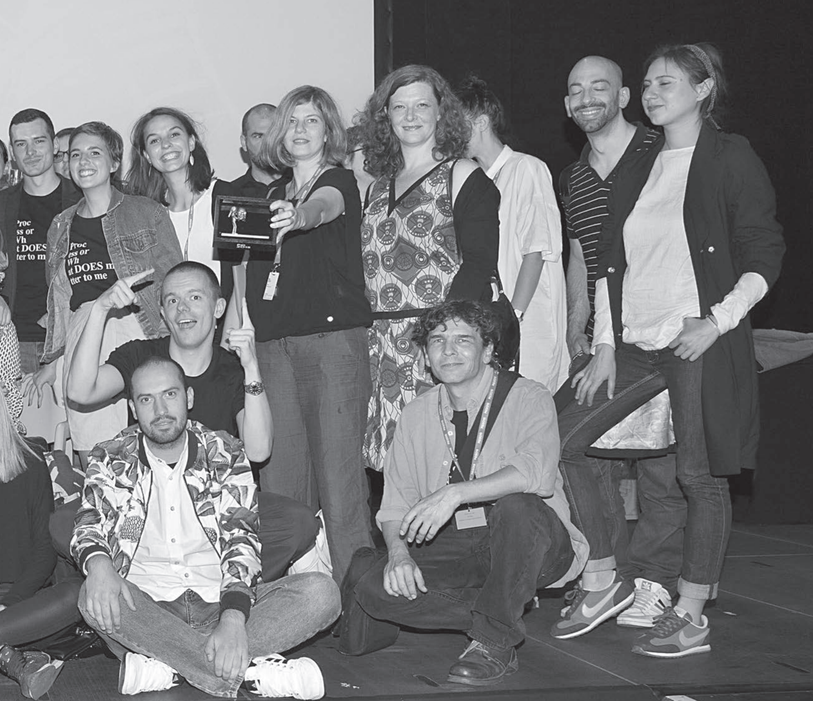
Златна медаља за покретање дијалога, PQ 2015, фото: Немања Кнежевић